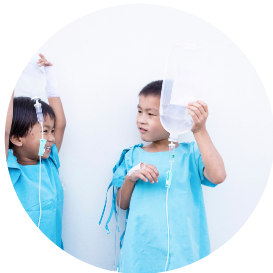
Klinika Transplantacji Szpiku, Onkologii i Hematologii Dziecięcej „Przyłodek Nadziei” we Wrocławiu