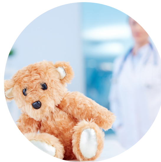
Wojewódzki Szpital Specjalistyczny im. J. Gromkowskiego we Wrocławiu