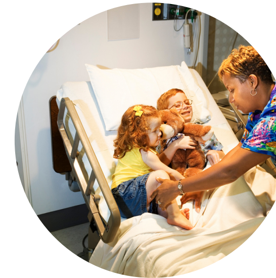
Szpital Wojewódzki im. Prymasa Kardynała Stefana Wyszyńskiego w Sieradzu